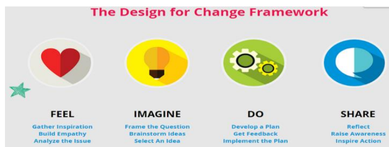
圖 1 DFC 的框架 3