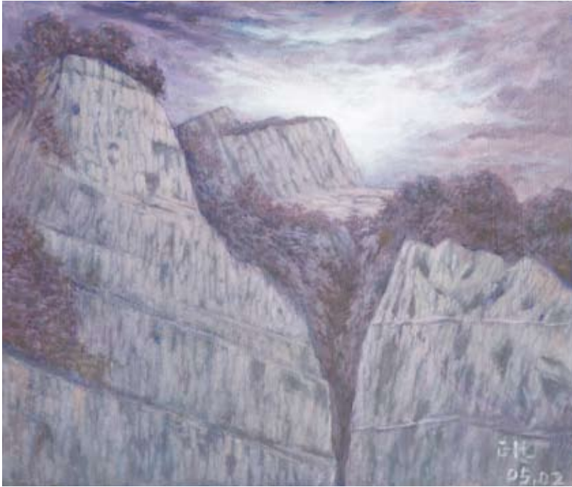
火焰山之晨 10F 油彩