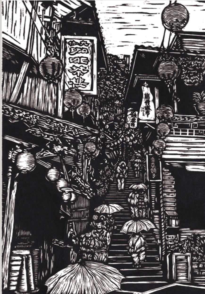
九份情懷 36×52cm 木刻版 2011

陳永欽先生1962年生於苗栗苑裡，定居新竹，家庭幸福美滿。大學專攻化工，現任職臺灣鑽石公司區經理。永欽藝術資質高，接觸素描、水彩、水墨創作，曾師承朱錦城與柯廷華老師進入版畫領域，為人誠懇率真且多才多藝，樂與人分享，現為新竹市美術協會監事、中華民國版畫學會會員，是中青代創作木刻版畫與年畫的模範生，版畫藝術成就高，是文建會年畫首獎常勝軍，榮獲第11屆、13屆、14屆、16屆之徵件版印年畫首獎殊榮，並且再接再厲榮獲53屆省展版畫類銅牌獎、大墩美展第三名、南瀛雙年展佳作、中華民國國際版畫雙年展入選等佳績連連。版畫作品榮獲國立臺灣美術館典藏殊榮，優秀作品常見於臺灣各類美展中，自2003年以來已獲邀舉辦二十餘次的創作個展與聯展，深為藝文界所肯定。他也是木刻版畫的推動者，受邀各文化機構與大學推廣版畫藝術，令人敬佩。