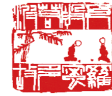
依般若波羅密多故