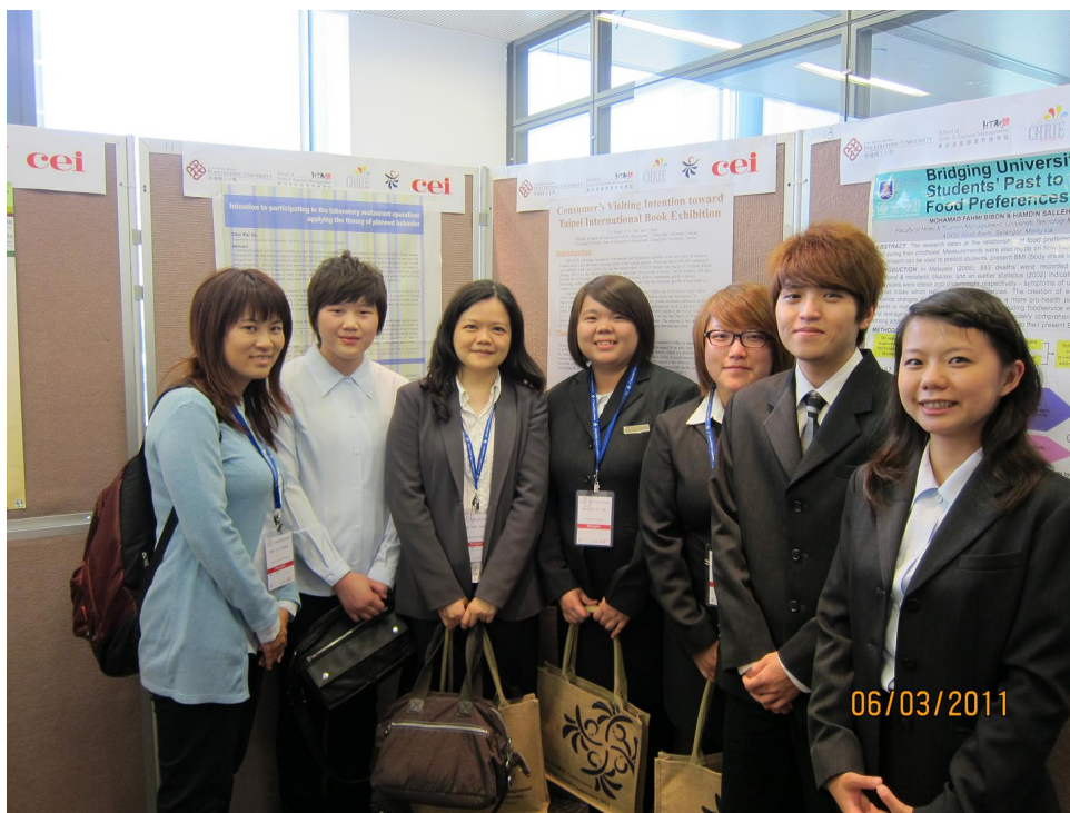
* 與學生在 poster 前合影

在這部分附上此次參與 9 th APacCHRIE Conference 的一些照片。