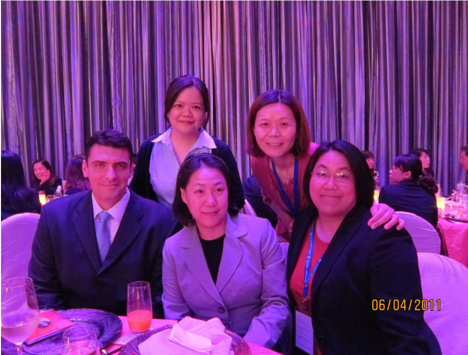
* 與博士班同學在 Gala Dinner 合影